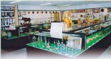
牛乳博物館内 世界各国の酪農文化に関する資料・収集品、約5,000点が展示されております。