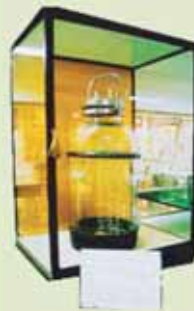
江戸東京博物館に出展した歴史的な牛乳ビン。 現千葉県成田市にあった御料牧場から、毎日牛乳を皇居に運んだガラスミルクカー。