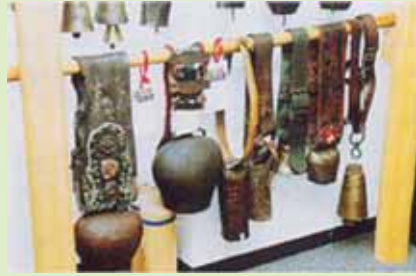
テレビ東京「開運なんでも鑑定団」に出展した、世界のカウベル。