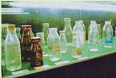
江戸時代末期に使用された日本最初のギヤマンの牛乳ビン等が展示されています。

その他、テレビ朝日「タモリ倶楽部」に出展したホルーン、フジテレビ「トリビアの泉」、日本テレビ「おもいっきりテレビ」等々に出展したものが所狭しと展示されております。皆さま、身近な牛乳の歴史・文化に触れてみてはいかがでしょうか。