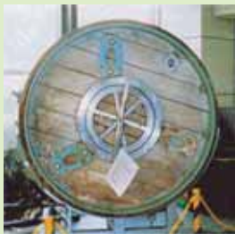
直径1.7Mの桜木使用の、国内に2機だけ保存されている日本最大の木製大型バターチャーン。(1回の生産量800ポンド)