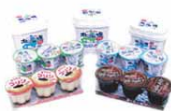
ヨーグルト・プリン・ゼリー